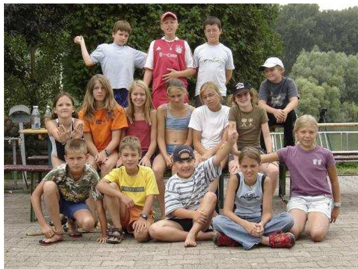
Bild: Kanucamp 2005